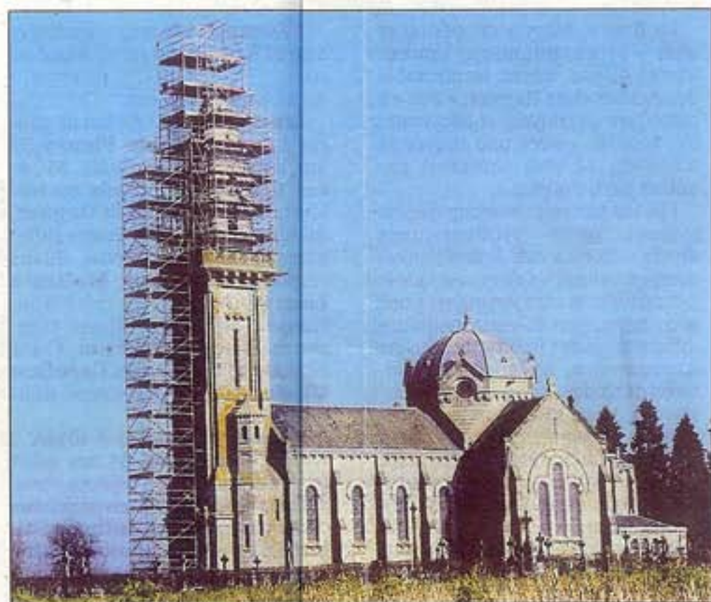
La statue rejoindra bientôt le clocher de la chapelle.

Dimanche matin, c'est par centaines que les membres de l'association, les habitants de Couterne et les curieux se sont pressés pour