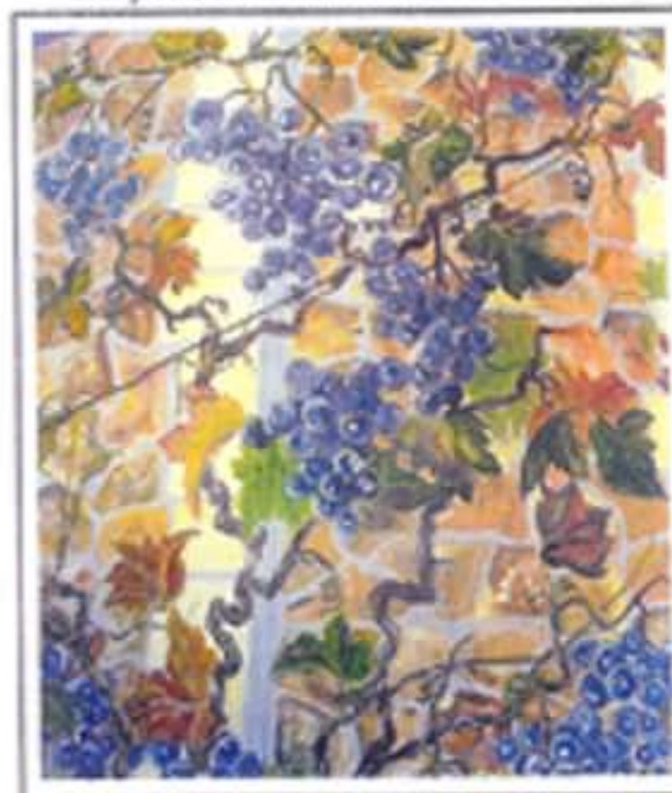
Un bon cru : « Château Menneval »