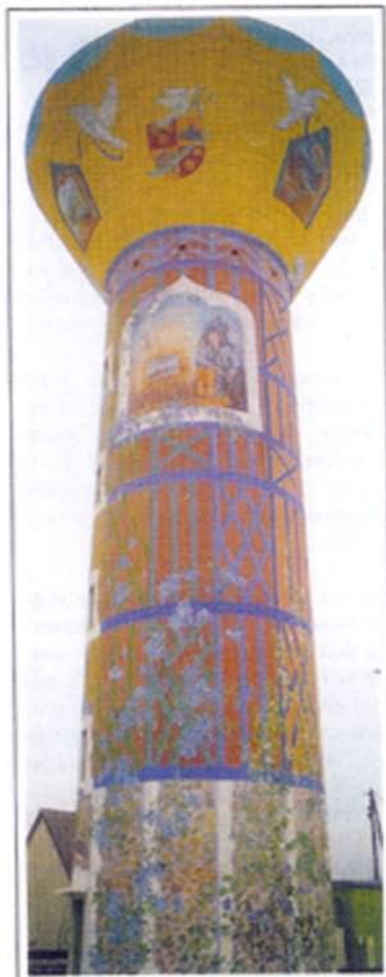
La finesse du décor