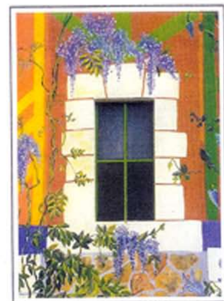
Fenêtre aux glycines