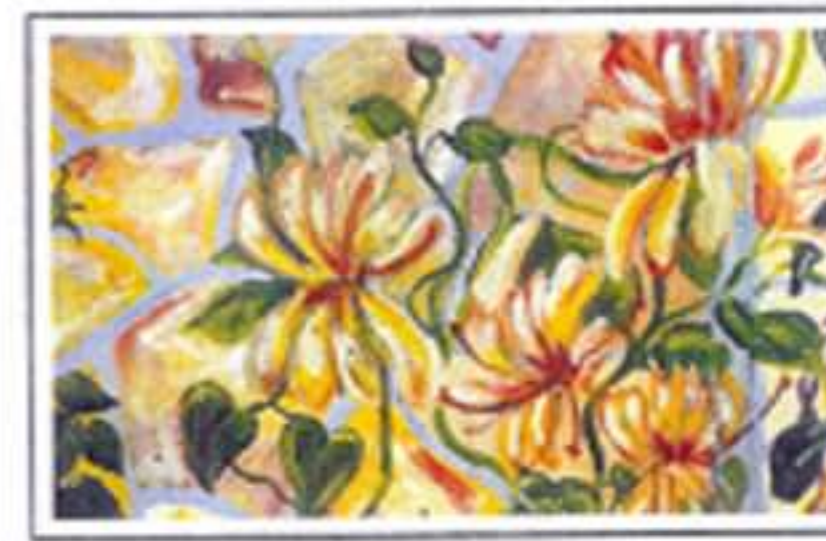
Floraison de chèvrefeuille

Plus tard, l'espace environnant sera aménagé (point d'eau, éclairage, etc...). Une étude sera proposée au Conseil municipal pour que ce lieu devienne convivial.