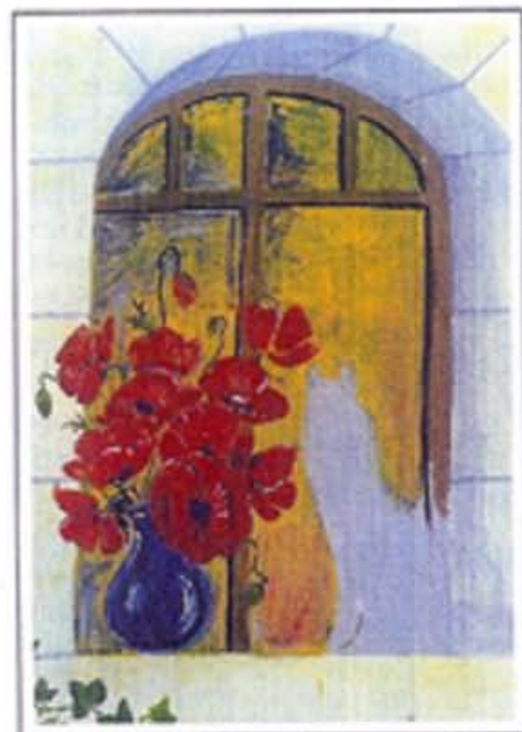
La place de Minou est réservée