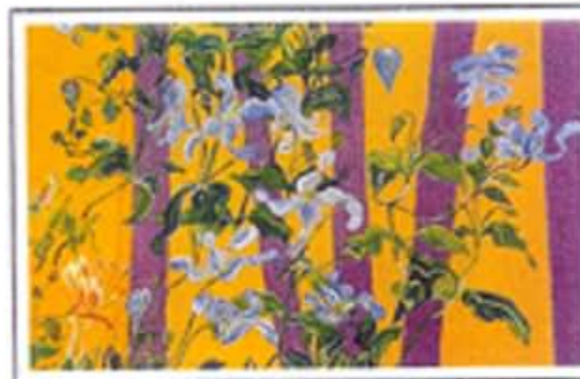
Clématites bleu ciel